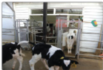
송아지의 발육과 영양상태에 따라 젖 먹는 양과 시기를 자동으로 조절하는 인공지능 로봇 '송아지 유모'

다가 송아지가 다가오면 나타나고, 정량을 다 먹으면 다시 숨어버려 과식이나 급체를 방지할 수 있다. '송아지 유모'는 축산기술에 첨단 IT기술이 집목된 사례로, 인력과 시간의 절감효과가 클 것으로 기대하고 있다.