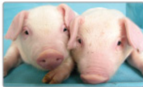
혈우병치료제를 생산하는 '형질전환 돼지' 개발

혈우병은 평생 치료제가 필요한 유전 질환이다. 혈액 속에 정상적인 응고인자(Factor VIII)가 부족하여 생기는 질병으로, 상처가 나면 피가 굳지 않아 계속 흐른다. 혈우병 환자에게는 혈액에서 정제한 치료제가 처방되는데, 바이러스