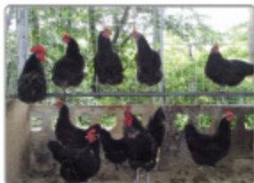
멸종위기에 처한 가축을 안전하게 보존하기 위해 마련한 중복보존축사의 긴꼬리닭과 흑색계를 재래닭