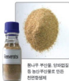
퐁나무 부산물, 양과껍질 등 농산부산물로 만든 천연항생제

우리 원은 항생제를 대체할 수 있는 사료를 개발했다. 농산부산물을 이용한 천연 항산화 물질이 함유된 사료 이다. 이 사료를 먹이면 가축의 면역력을 강화시키는 것 외에 증체량도 늘어나는 효과를 얻을 수 있다. 양계농가에서 한 달간 실험한 결과에 의하면, 증체량은 3.8~7.3% 증가했고 닭고기 불량률은 절반 정도 감소했다. 특히, 이밖에 개발한 사료는 퐁나무 부산물, 포도껍질이나 포도씨, 또 양과껍질 등을 이용한 것으로 경제성도 높은 것으로 판단된다.