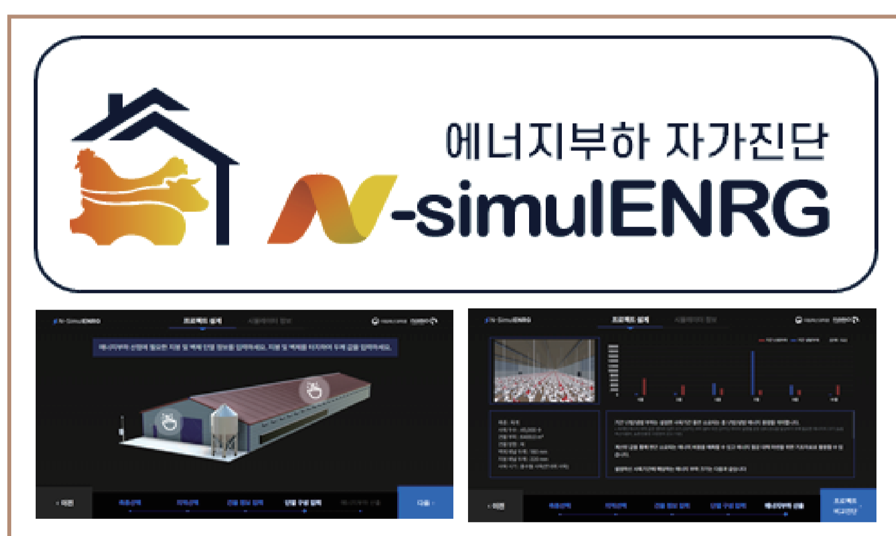
<에너지 부하 자가진단 육계 앱>