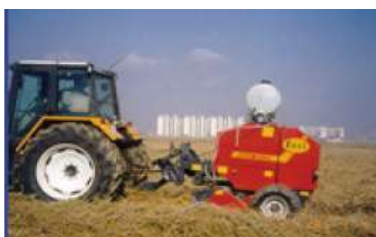
〈 첨가제 처리 〉