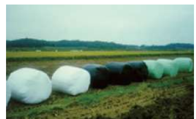
〈 저장 〉