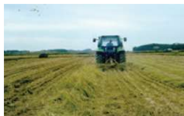
〈 볏짚 모으기 〉