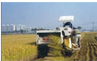
〈 벼 수확 〉