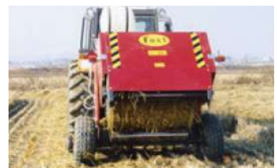
〈 원형곤포 조제 〉