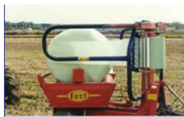
〈 비닐 감기 〉