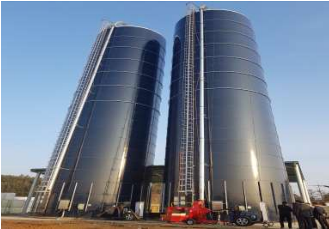
〈 기밀사일로 〉