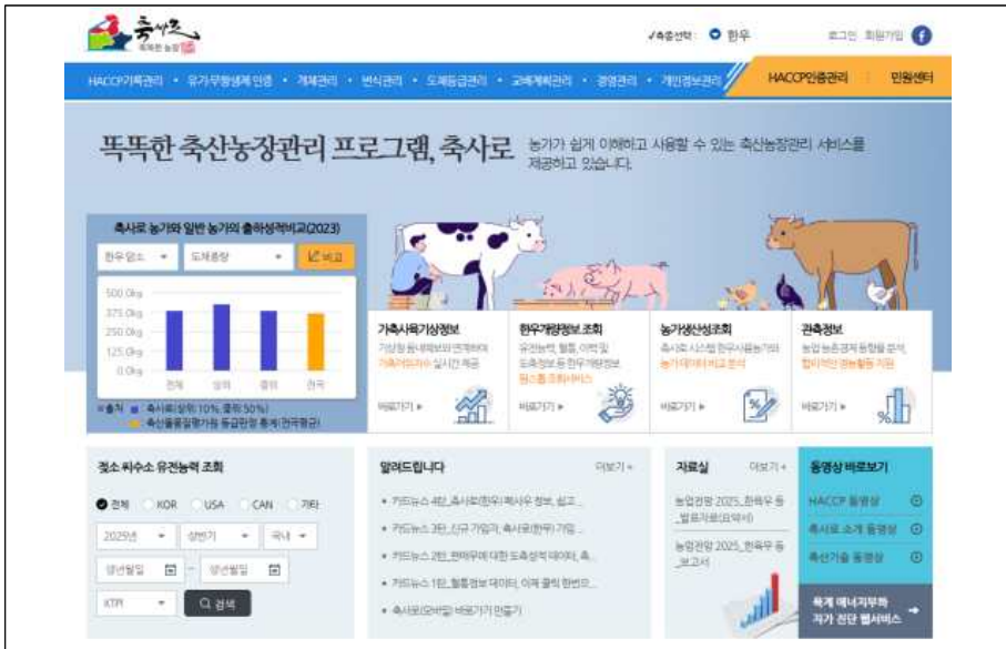
축사로 홈페이지 화면