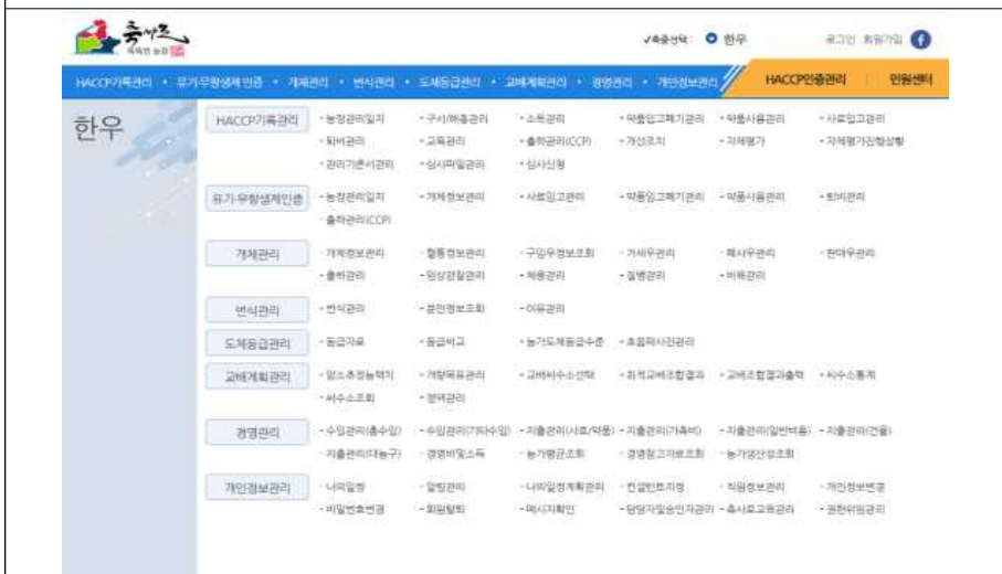
축사로 메뉴 구성도 화면