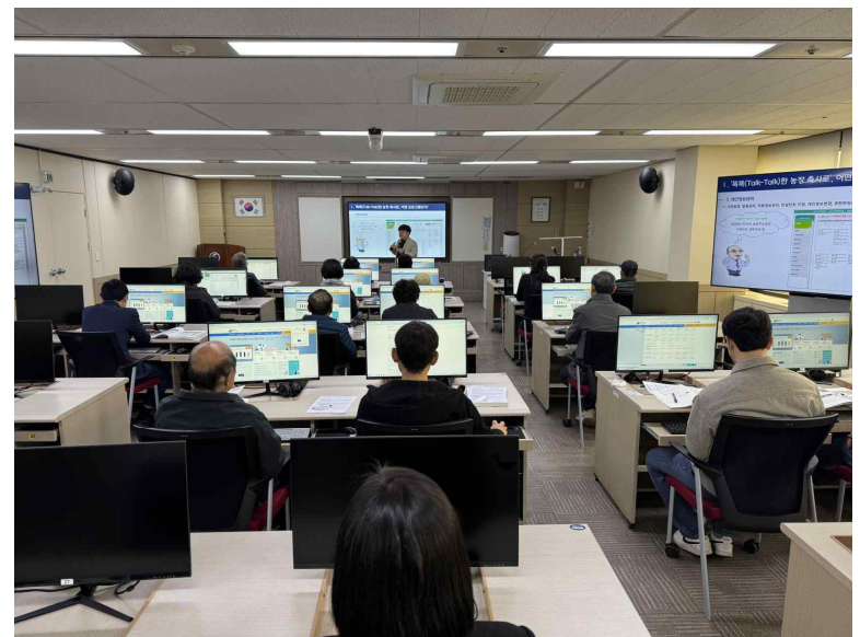
충주시 한우농가 대상 '축사로' 교육실시(2024.3.29.)