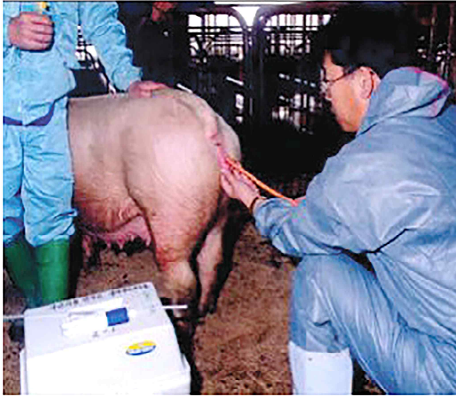
주입기 삽입 요령