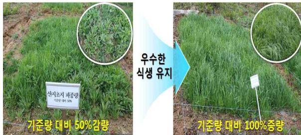
산지초지 걸뿌림 파종시 파종량에 따른 식생비교(평창)