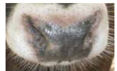
<흑우(내륙흑한우) 사진 : 모색 및 비경색>