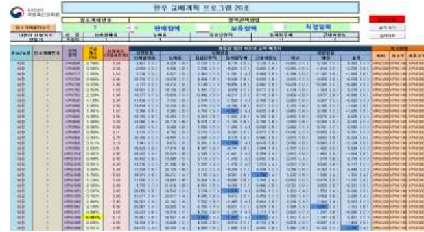
2019 하반기 한우 교배계획 길라잡이 엑셀 프로그램

○ 프로그램은 국립축산과학원 누리집(www.nias.go.kr, 연구 활동→ 농가 활용 프로그램)에서 내려 받을 수 있다.